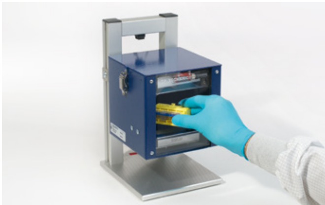
Reinigung von kleinen Bauteilen während des Montageprozesses Cleaning of small parts during assembly