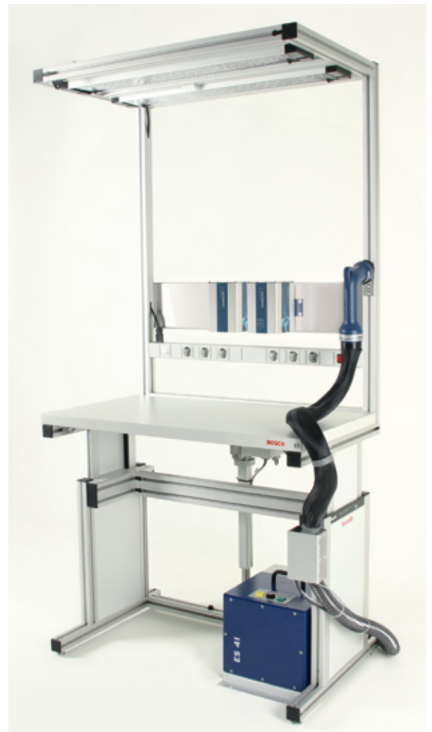
Arbeitsplatzbeispiel Example workplace

Hinweis: Technische Informationen s. Zubehör/Datenblatt Advice: Technical information s. Accessory/Datasheet