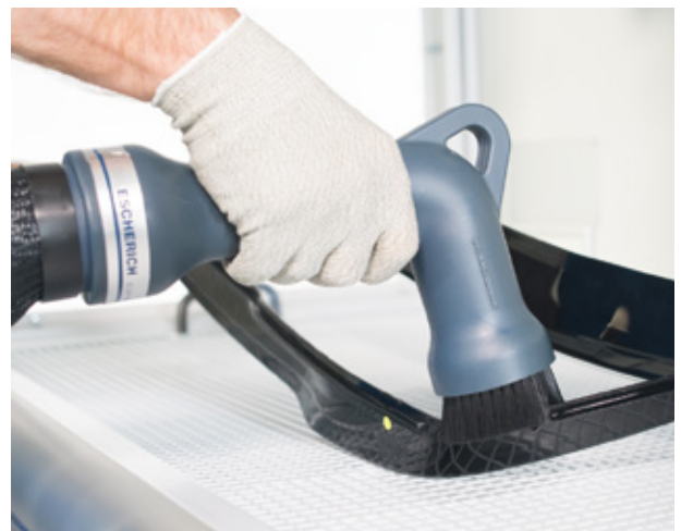
Anwendungsbeispiel ELEPHANT 110 Example application ELEPHANT 110